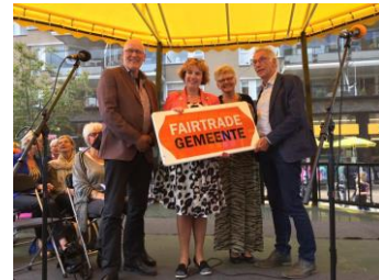
De burgemeester neemt de titel in ontvangst