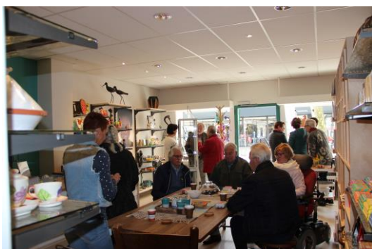
Vrijwilligers van Stichting De Welle halen de paasattentie op en drinken een kopje koffie.

Stichting De Welle heeft haar vrijwilligers voor Pasen een doosje Tony Chocolonely paaseitjes cadeau gedaan. Deze konden in de winkel opgehaald worden onder het genot van een kopje koffie. In korte tijd hebben wij ruim 350 bezoekers in de winkel gehad.